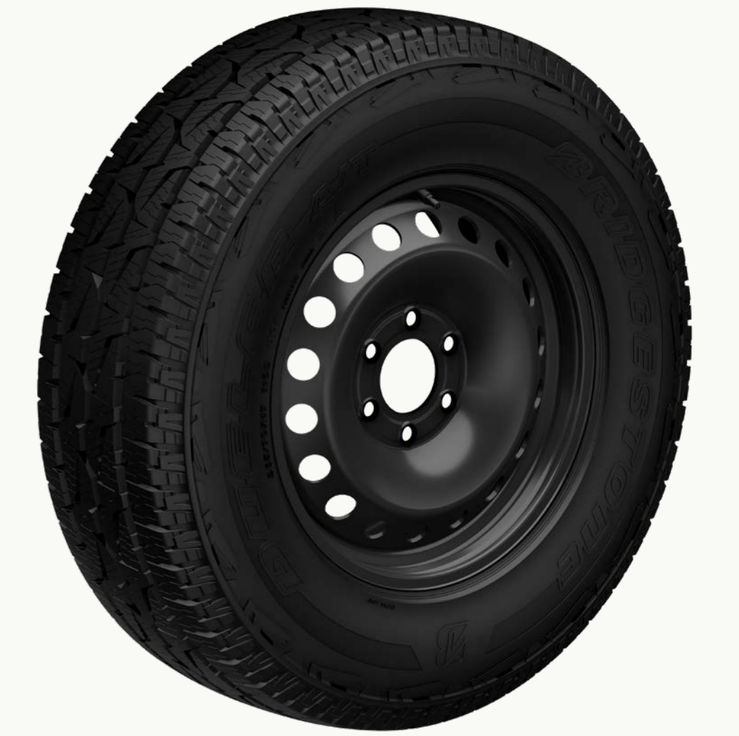
إطار BRIDGESTONE ALL-TERRAIN