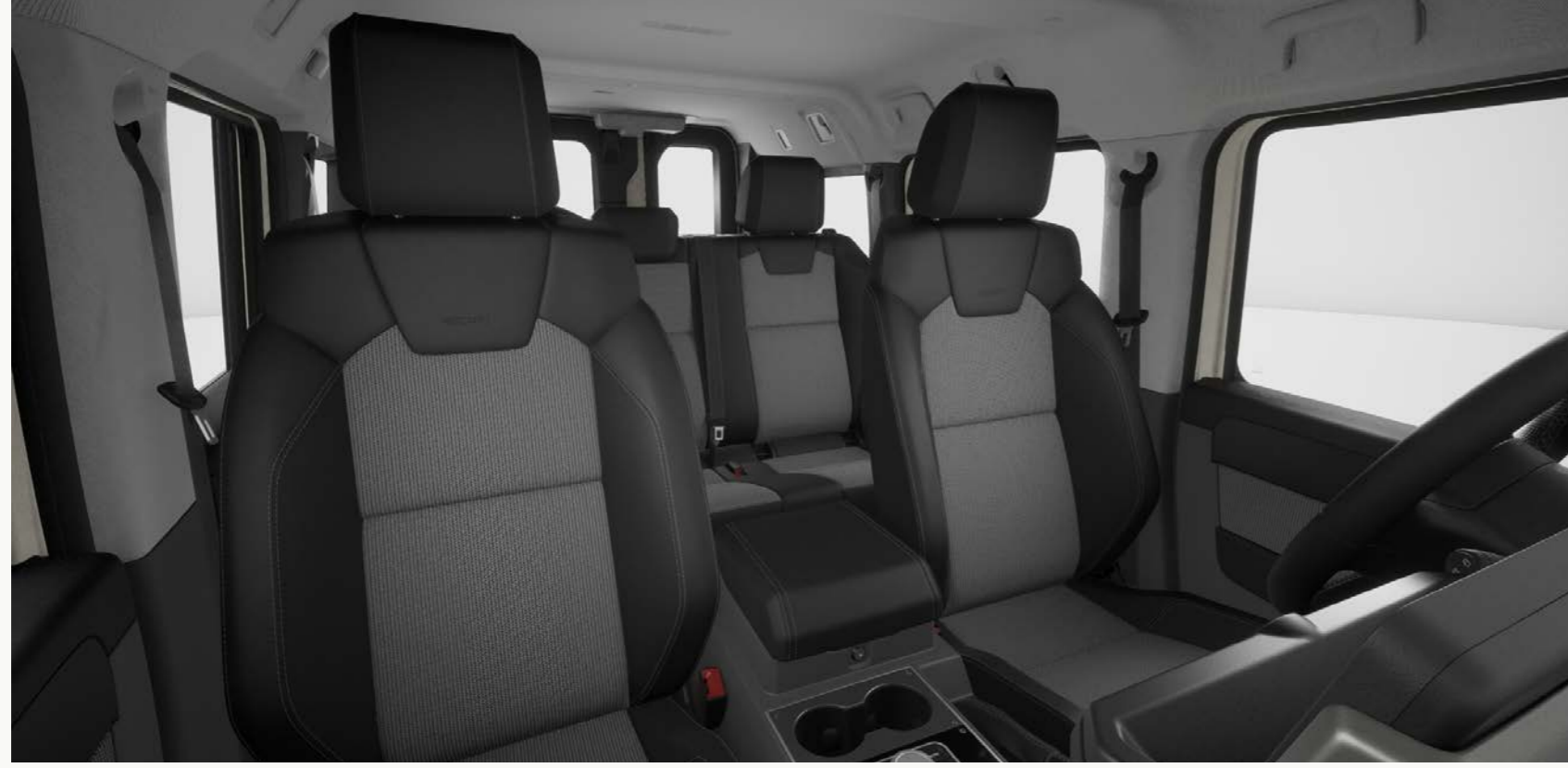
تزيينات جلدية - سوداء